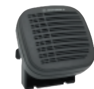
Haut-parleur Externe 13W