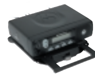
Monture à Glissière Amovible

Les radios mobiles polyvalentes de la Série Commerciale conviennent particulièrement pour les sociétés de taxis, de Messagerie et de Livraison pour lesquelles la Transmission de données permet une diffusion rapide des informations des passagers et des informations livraison. Les options de montage permettent d'enlever facilement et rapidement la radio quand le véhicule n'est pas utilisé. Pour les entreprises travaillant pour l'agriculture, l'environnement ou l'écologie, les travailleurs isolés sont protégés par les dispositifs de sécurité intégrés de manière à ce que l'aide et les conseils des collègues soient accessibles par simple appui sur une touche. Pour les communautés urbaines, l'appel individuel est idéal pour le contact entre le superviseur et les membres de l'équipe sans déranger les collègues occupés.