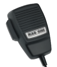
Microphone Mag One