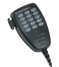
Microphone à Clavier de Téléphone